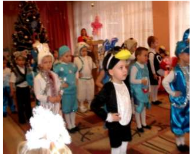
II середня група «Калинка»