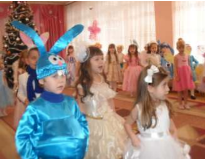
III середня група «Ромашка»