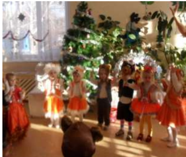
II ясельна група «Колобок»