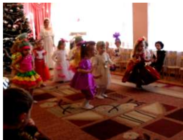
I молодша група «Горобинка»