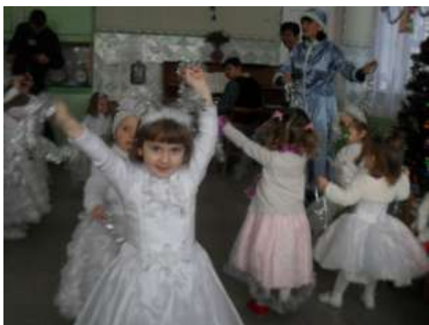
III ясельна група «Віночок»