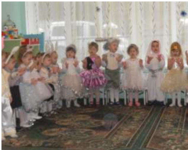
I ясельна група «Казка»