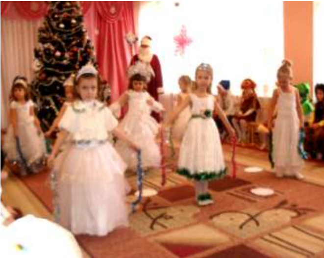
I середня група «Веселка»