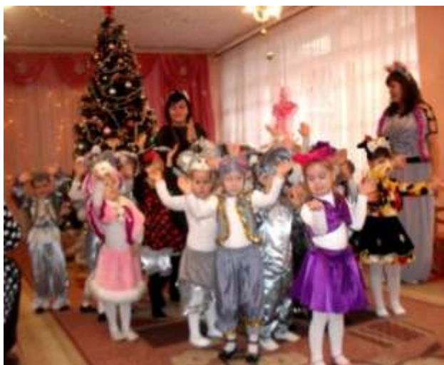
II молодша група «Берізка»